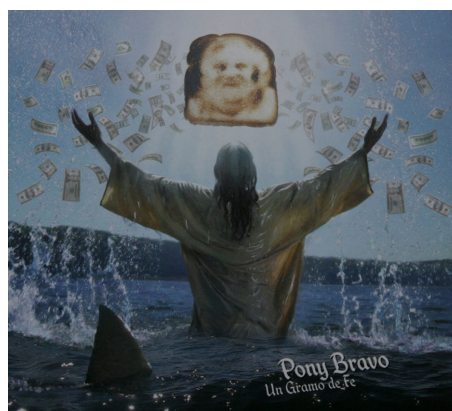
Figura 2. De izquierda a derecha: Si bajo de espaldas no me da miedo (2008) y Un gramo de fe (2010).